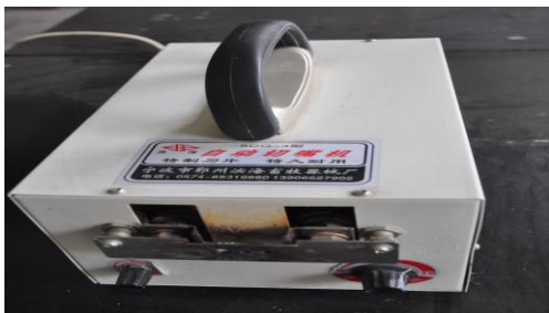
图 7-6-1 电热自动断喙器

插上电源，将刀片烧的灼热发红色，断喙器刀片温度为 800℃左右，此时，断喙操作者，左手抓雏鸡 A 和 B 两只（修喙鸡一只），A 鸡置于拇指与食指之间，B 鸡置于左手的无名指和小指之间备用。右手拇指压住 A 鸡的头顶，食指放在咽下并稍向上顶可使