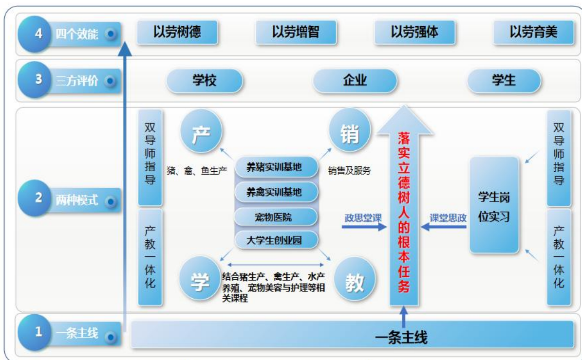
图2 畜牧兽医专业群“1234”一体化课堂革命模式图

“一条主线”：坚持以党建引领、落实立德树人的根本任务为主线，把社会主义核心价值观体系融入职业教育全过程，实施课堂思政。